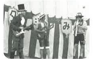
夕涼み会でバンド結成

職員は働くことのサポートから生活全般の支援や相談業務など、それぞれ専門性が異なった職員構成になっています。普段はそれぞれで活動を