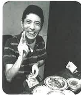
個別余暇で食事を楽しむ

「重度・高齢化」が進む中で、こうした取り組みは利用者の方が楽しめる良い機会となっており、今後も継続して取り組んでいきたいと思えます。