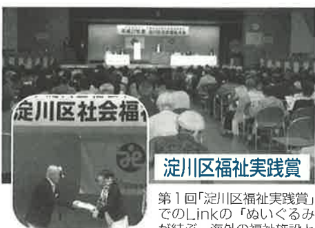
定川区福祉実践賞

【10/14】 第1回「定川区福祉実践賞」でのLinkの「ぬいぐるみが結ぶ、海外の福祉施設との絆～社会とのつながりと仕事のやりがい～」の取り組みが銀賞を受賞