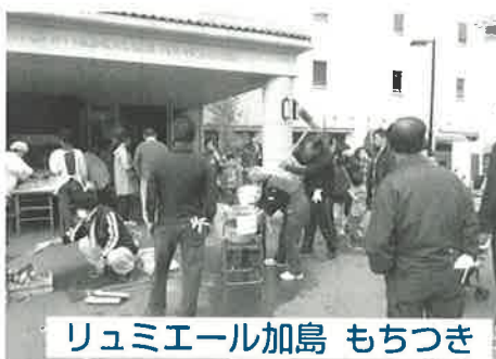
リュミエール加島 もちつき

【10/14】 第1回「定川区福祉実践賞」でのLinkの「ぬいぐるみが結ぶ、海外の福祉施設との絆～社会とのつながりと仕事のやりがい～」の取り組みが銀賞を受賞