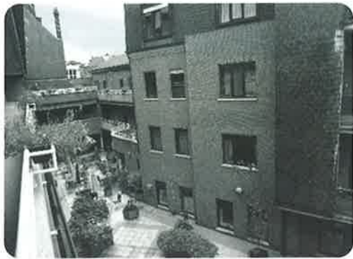
ベルギー：アシスタント付き住宅

また、ベルギー・オランダともに高齢化問題にどう対応していくかが課題であり、これは先進国共通の課題であることも改